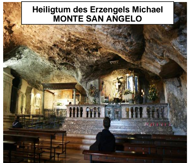
Heiligtum des Erzengels Michael MONTE SAN ANGELO

Tag 2 Weiterfahrt zum berühmten Sporn Italiens', der Halbinsel GARGANO - Es folgen schöne Besichtigungen rund um GARGANO mit inklusive Schiffsfahrt und Vieste mit seiner malerischen Küste – dann sind Sie auf den Spuren des weltweit verehrten Padre Pio in San Giovanni Rotondo plus ein sehr interessanter Besuch in MONTE SAN ANGELO , dem beliebten populären Heiligtum des Erzengels Michael, mit der berühmten Grottenkirche, eine ursprünglich normannische Michael-Wallfahrtskirche Abendessen und Übernachtung in Ihrem guten Hotel.