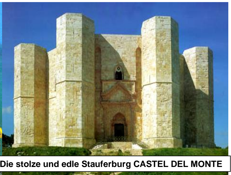
Die stolze und edle Stauferburg CASTEL DEL MONTE