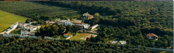
Restaurant und Weingut von AL BANO